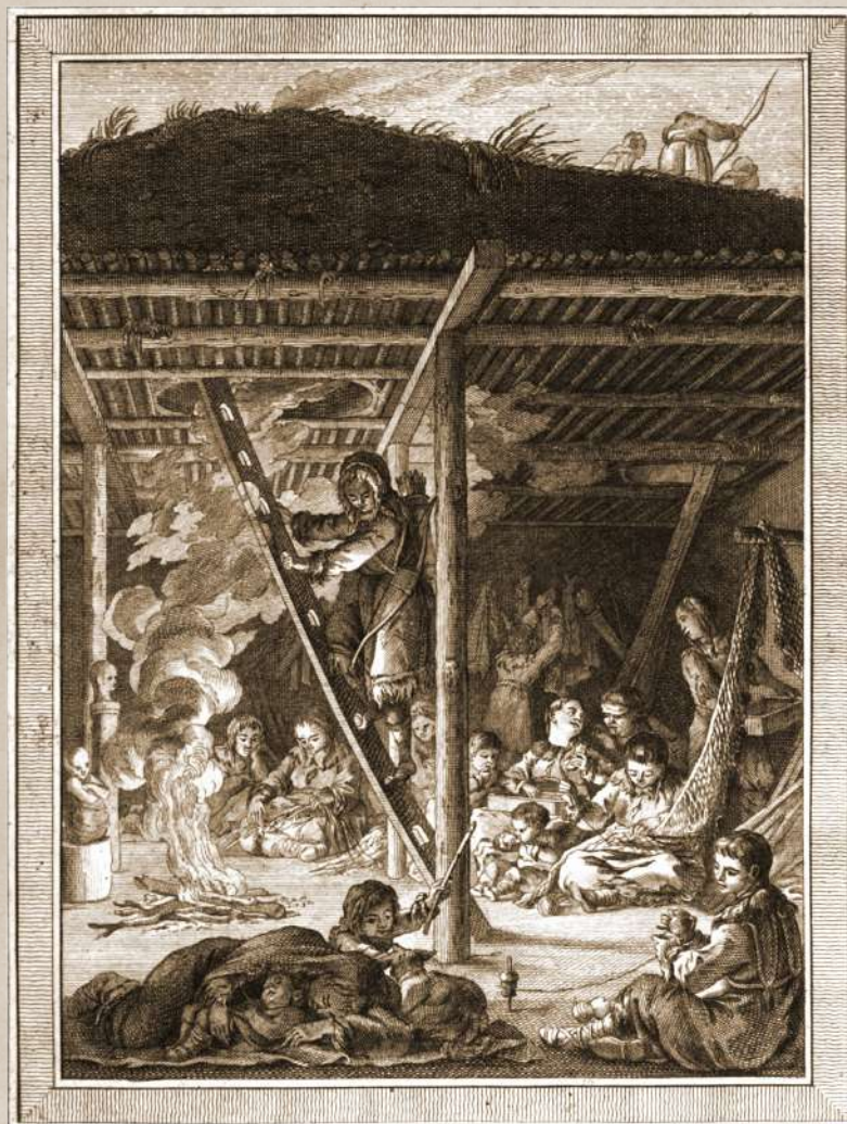
Habitation souterraine familiale dérimache

Peuple de forêt boréale, ses cavaliers surgissent des lisières enneigées à dos de cheval pour s'adonner au pillage des caravanes. Pour un jeune dérimache ayant reçu sa première armure de cuir, l'honneur suprême consisterait à abattre un anaru, sorte de tyrannosaure des neiges, ou à prélever la sève sacrée de l'arbre tasi.