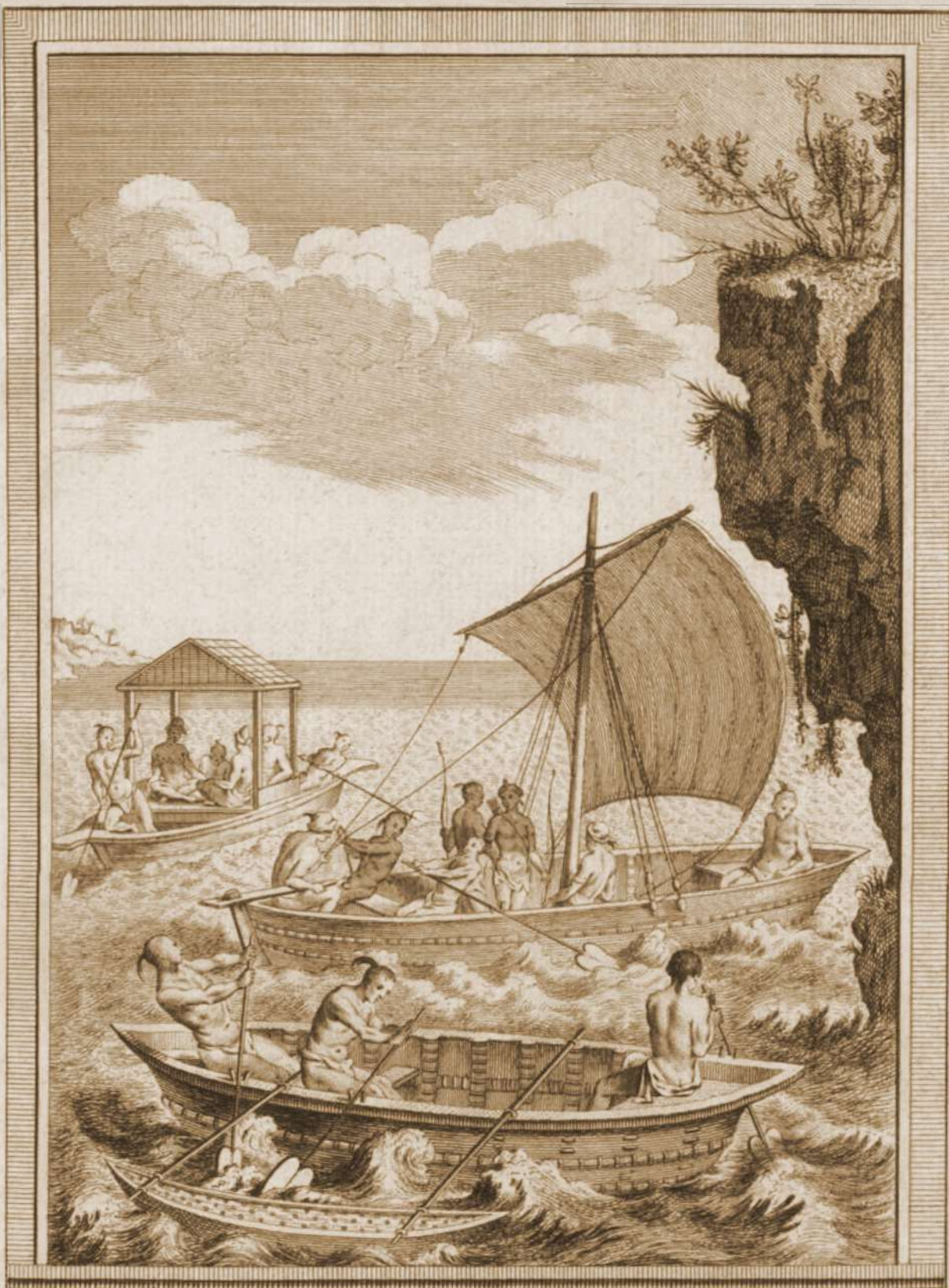
Piroguiers natifs du lac Promachis