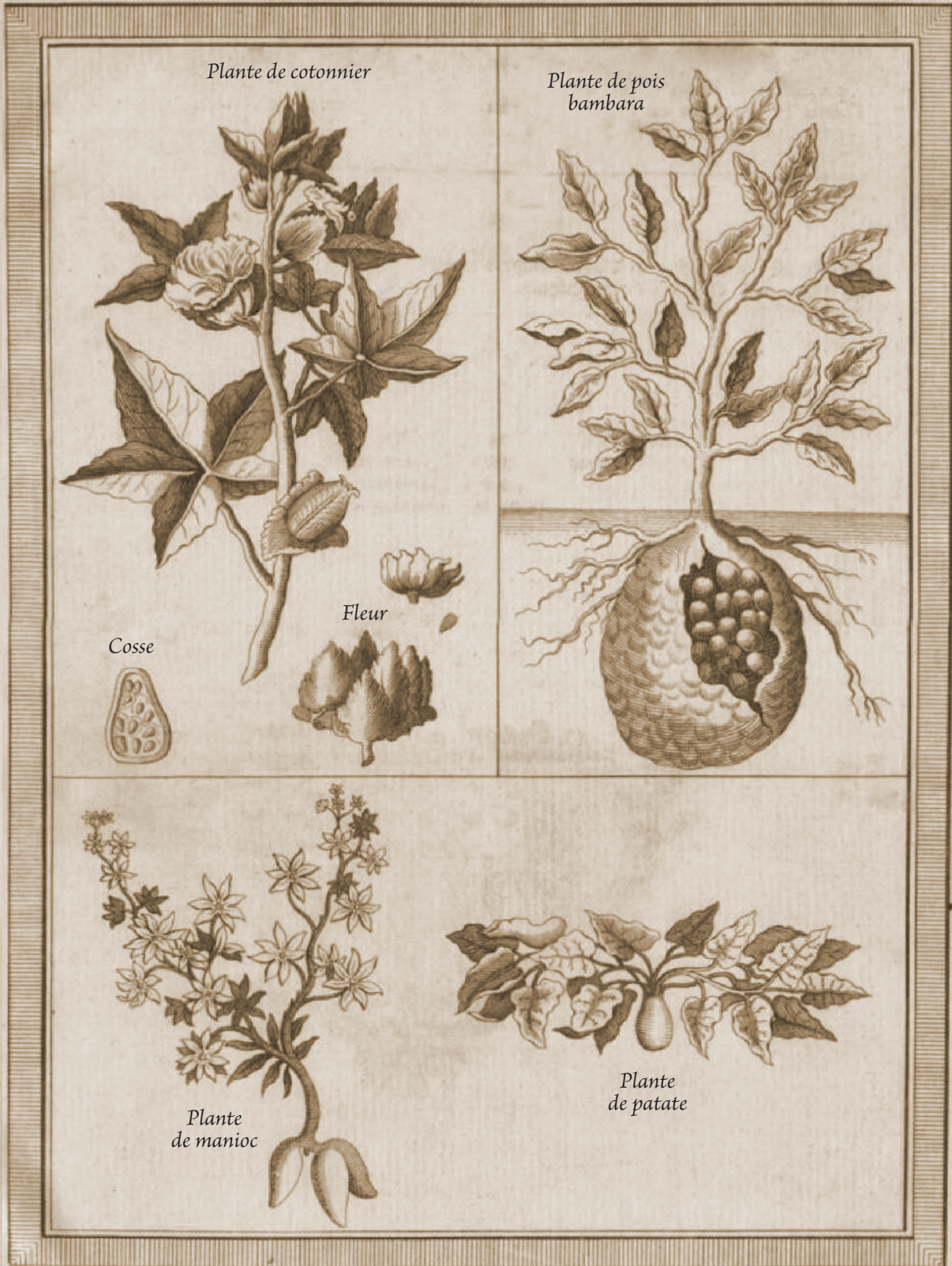
Quelques plantes vivrières des peuples natifs