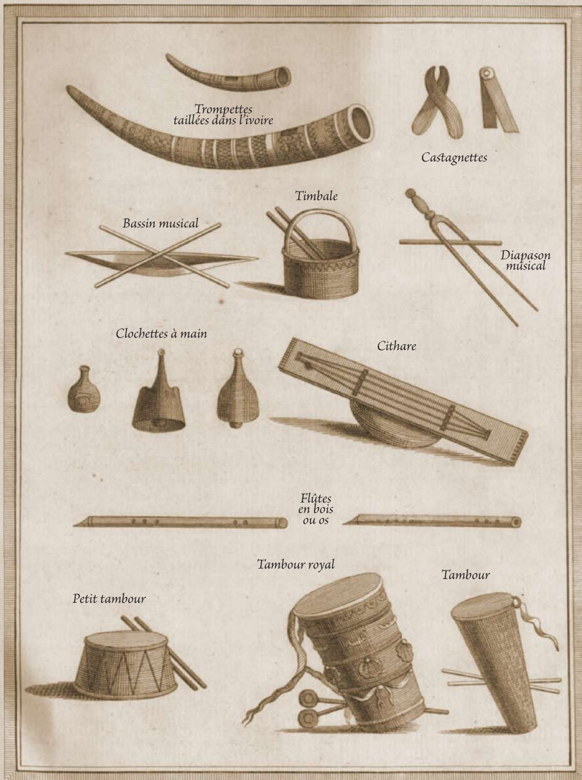
Instruments de musique des vieux peuples de Teur