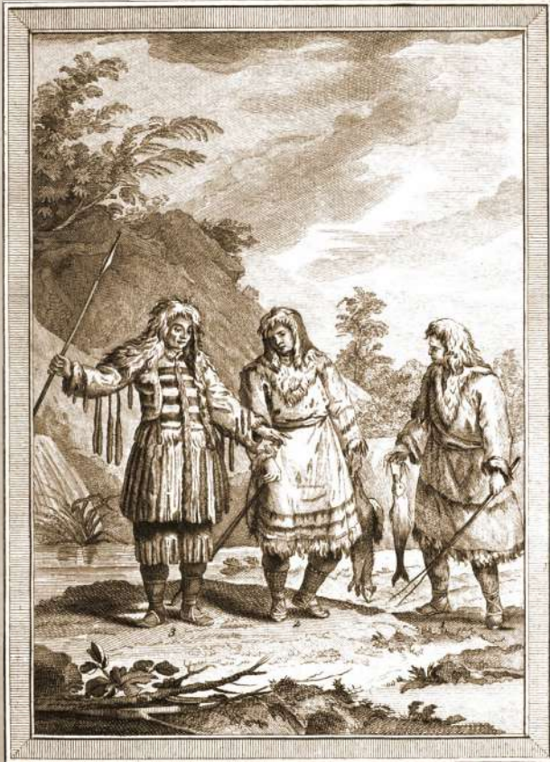
Chasseurs de baleines goranka

Cette Nation autochtone, la plus australe de la Communauté, est sise sur une grande île environnée toute l'année de banquise. Très bons archers et très bons chasseurs de krakens, de morses, de baleines et d'orques, ces peuples courageux et amicaux luttent contre les incursions périsciennes venues d'Èrèbe. Pour eux, l'amitié de la Communauté, et l'aide qu'elle leur fait occasionnellement parvenir, est précieuse.