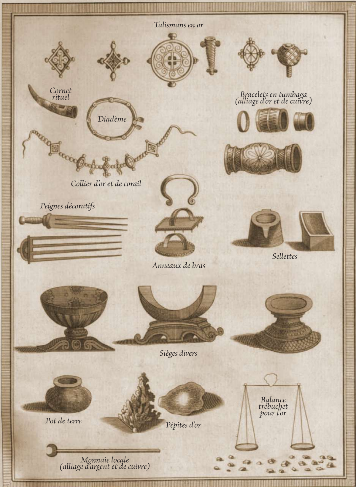
Quelques trésors natifs ou autochtones